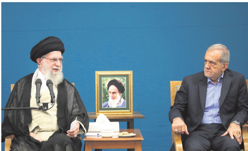
חמינאי בפגישתו עם נשיא אירן בטהרן |

כל מוקדי המשבר מייצגים את קו העימות בין העולם החופשי לעולם המתון, כולל סעודיה, מצרים, האמירויות, בחריין, ומרוקו שהינן מדינות בעלות אוריינטציה מערבית. עד כה קווי העימות היו מעט מטושטשים ומאז מלחמת אוקראינה, כשאיראן, רוסיה וסין התקרבו, הקווים שלו נהיו יותר ברורים, כשה-7 באוקטובר היווה עוד עליית מדרגה בעצם כך שהוא אילץ את המדינות לבחור צד וכך התחדדו קווי העימות בין גוש המערב לבין ציר הרשע של רוסיה, איראן, סין וצפון קוריאה. מה לגבי ישראל?